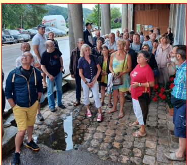
Visite guidées : former de nouveaux guides est une nécessité.

Les bénévoles du Musée Vosgien de la Brasserie se dépensent sans compter. Même si la passion est toujours présente, certains demandent à souffler un peu. Le moment est certainement venu d'avoir une réflexion sur l'avenir du musée. Nouvelle organisation, apport de jeunes bénévoles, etc. Au cours de l'année 2026, il conviendra d'en débattre tous ensemble, à la buvette lors de réunion spontanées ou officielles.