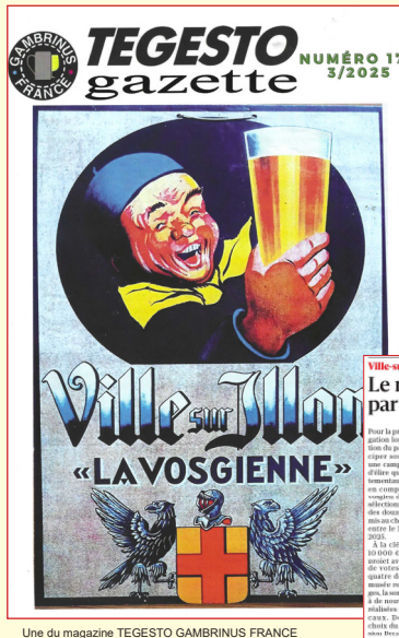
Une du magazine TEGESTO GAMBRINUS FRANCE