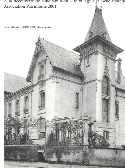
Le château LOBSTEIN, site classé.