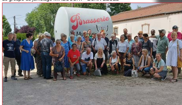
Le groupe du jumelage MIRECOURT - BONN BEUEL