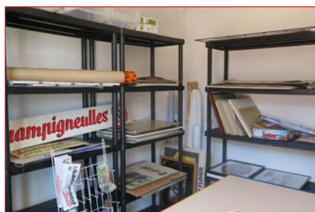
La nouvelle salle d'archivage

Bernard a continué le nettoyage de la salle des machines mais aussi le décombrement de la salle contigüe découverte récemment. Sandrine a contribué à améliorer l'état de la montée d'escaliers au moulin à malt.