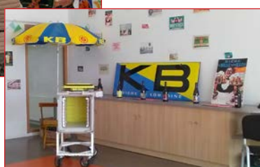
Expo à CHATEL