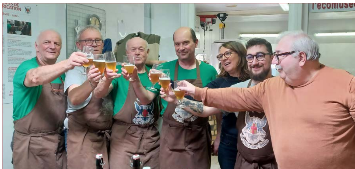
La convivialité avant tout

Une nouvelle salle de convivialité, du nouveau matériel, des présences sur les événements à XARONVAL et à TOUL, des reportages télévision, nos brasseurs ont eu une année intense, en plus des nombreux brassins réalisés qui réjouissent notre clientèle.