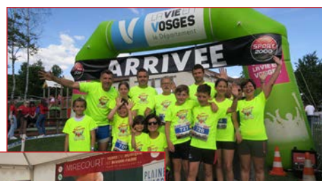
La belle équipe

Nos bénévoles s'activent pour promouvoir le musée. Ils étaient présents à LA LORRAINE EST FORMIDABLE à TOUL, à CHATEL et au THILLOT, et pour la première fois la brasserie a participé en équipe au trail nocturne de LA VILLAINES ou d'ailleurs les participants reçoivent une bouteille de B.V.