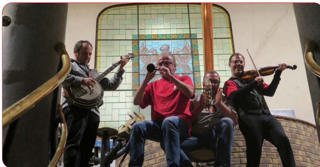
Camerelle dans la grande salle de brassage