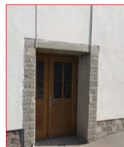
La nouvelle porte de secours