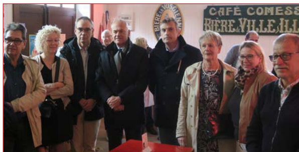
Les élus lors de la signature de la convention