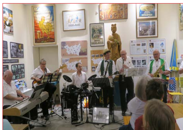
The New Orleans Magic Systeme