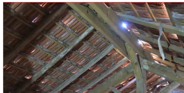
Vue des charpentes à rénover

Si les bénévoles ont à cœur de sauver le patrimoine de la grande brasserie et malterie vosgienne, c'est en pensant à l'avenir et à ceux qui reprendront les rênes de ce site industriel unique.