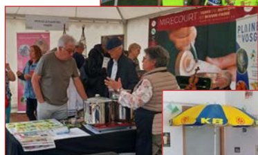
La lorraine est formidable