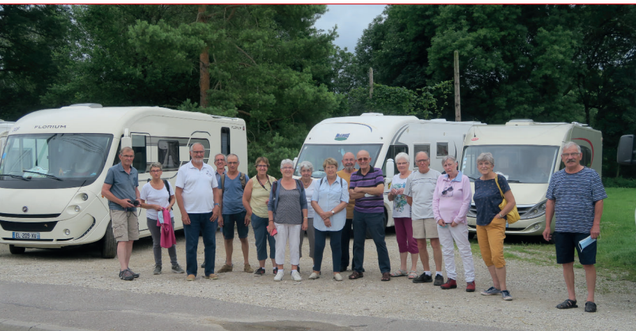
LE GROUPE FRANCE PASSION EN VISITE

Camping-cars, motos deudeuche et voitures anciennes, notre musée est souvent un lieu de rendez vous pour les groupes qui sillonnent les routes vosgiennes.