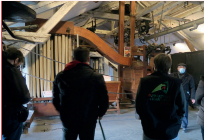
LE PRESSE VISITE LE MOULIN