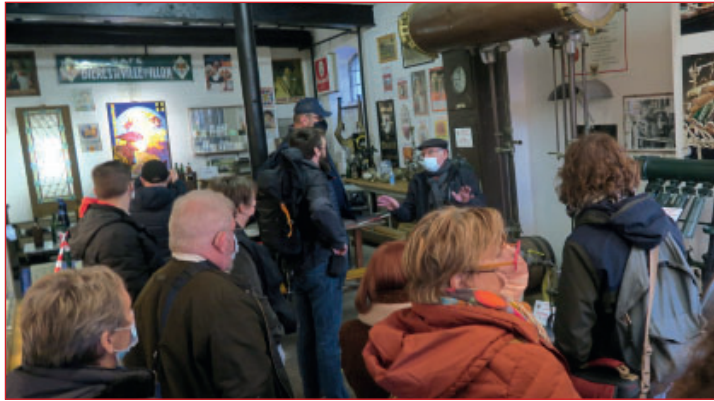
PASSAGE AU CAFE D'ANTAN