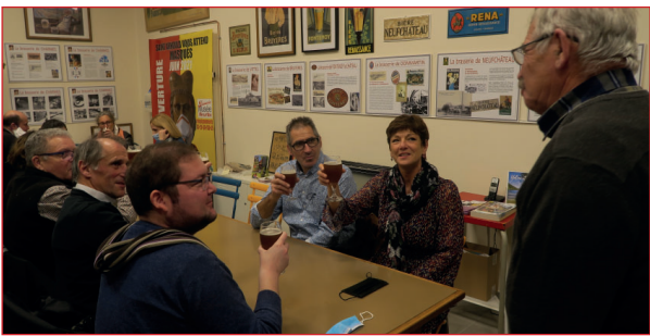
DES ELUS RAVIS DE LEUR SOIREE