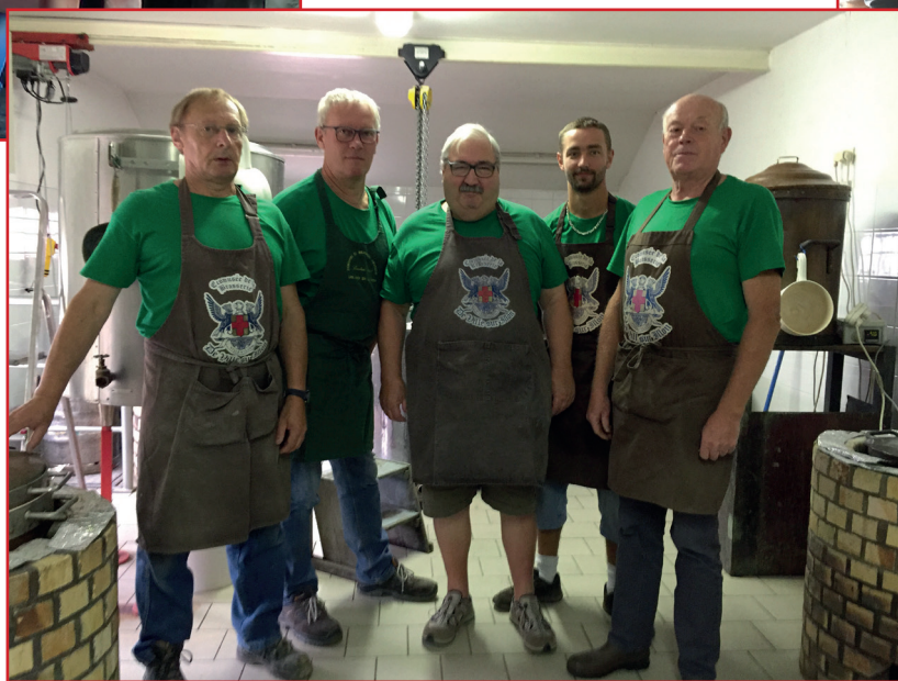
A la micro brasserie